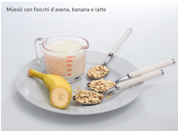
Müesli con fiocchi d'avena, banana e latte